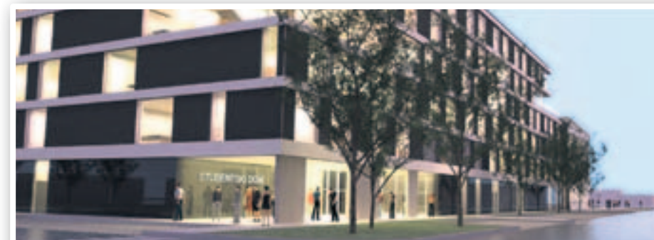
U skupu novog studentskog kompleksa studenti će imati ambulantu i praonicu rublja

akademske godine predviđen je dovršetak objekta, tehnički pregled i puštanje u rad (ovisno o ishodima javnih nabava odnosno eventualnim žalbama)