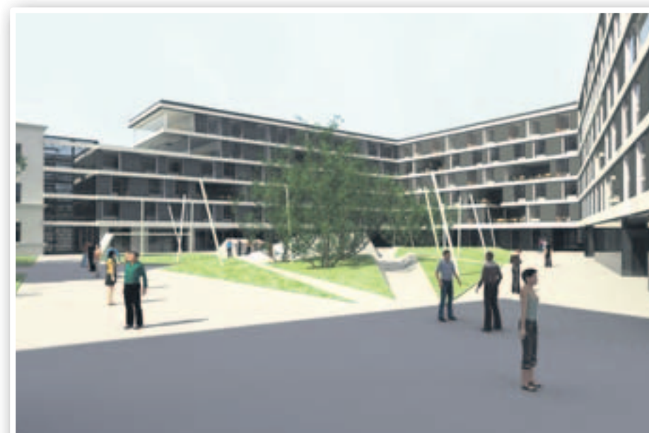
Dva doma međusobno će biti povezana u jednu sjelinu, a spajat će ih veliko dvorište